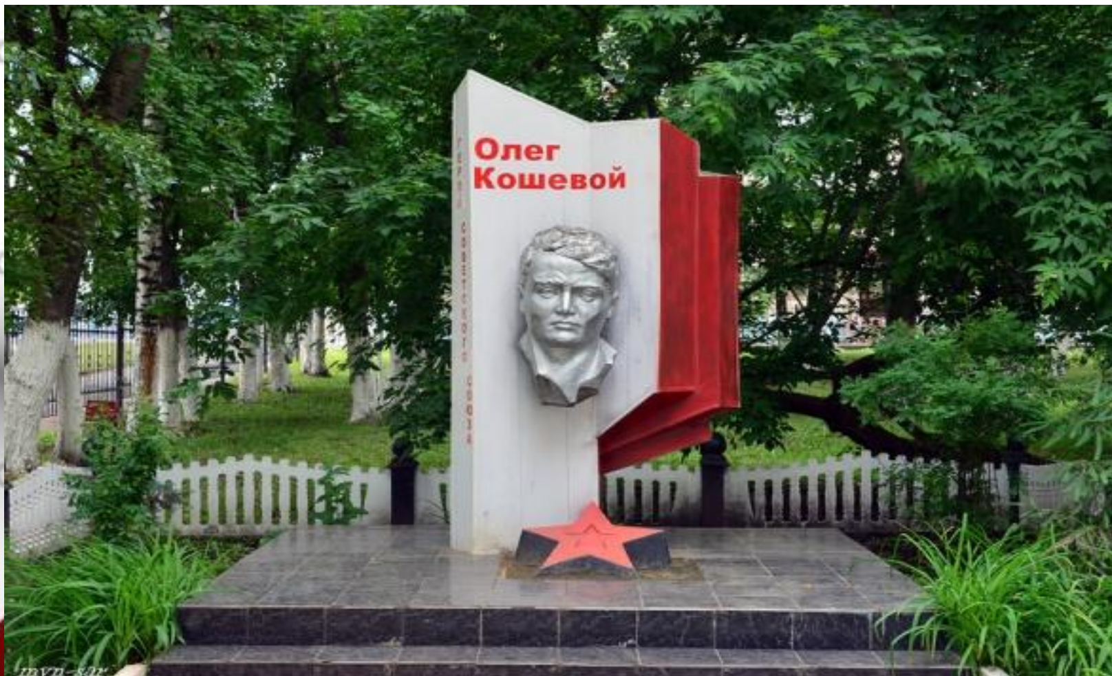
Памятник Олегу Кошевому. Молодогвардейцу, Герою Советского Союза.